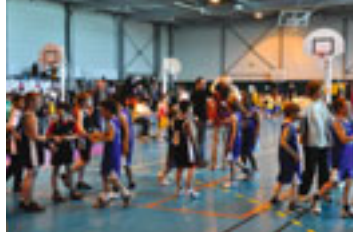
La fête du mini-basket avec le SPF de Gragny dans l'Eure, en partenariat avec Kinder.