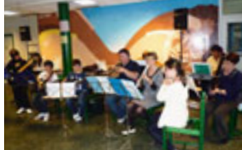
Tombola et concert à Vaux-le-Pénil (Seine-et-Marne), le 11 mai, pour les populations en difficulté à Mayotte.