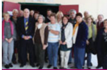
Le président du Secours populaire reçu, fin avril, par les bénévoles de l'île de Groix.