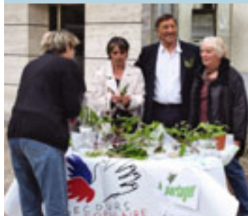
À Chateau-Thierry (Aisne), le maire salue les bénévoles qui vendent le muguet du 1 er mai.

L'activité du Secours populaire par les bénévoles.